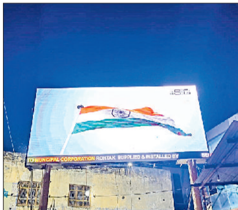
रोहतक। मेडिकल मोड़ पर लगाई गई एलईडी स्क्रीन।