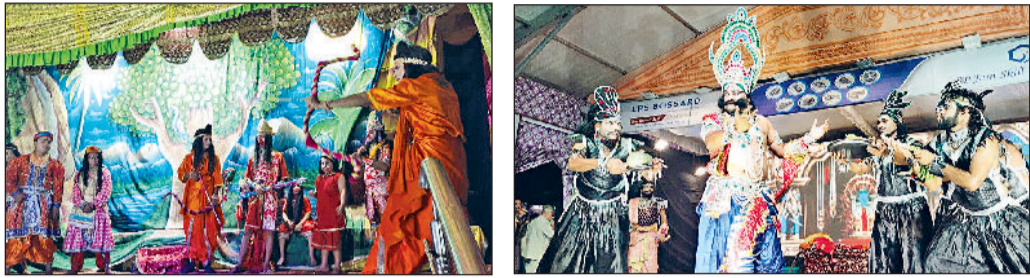
रोहताक। रामलीला के दौरान मंच पर अभिनय का प्रदर्शन करते कलाकार।