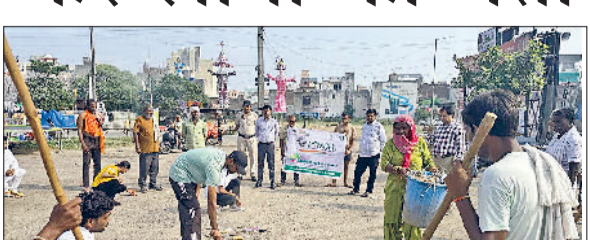
रोहताक। बीएमयू के विद्यार्थी शहर में सफाई करते हुए।